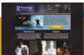
Routledge Performance Archive Routledge 演艺档案