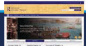
Routledge History of Economic Thought Routledge 经济思想史

https://www.routledgehistoricalresources.com/economic-thought/ 汇编了原始文献、二次文献，包括图书章节、专题论文和期刊文章，为学习1700-1914年的经济思想史提供了珍贵的资源。读者可通过主题、现代思想、著名人物、年代和内容类型进行浏览。