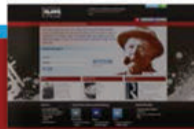
Partridge Slang Online Partridge 在线俚语词典

以独有的方式提供空前广泛的古往今来演艺艺术家音像资料，使教学更生动，促进研究工作。